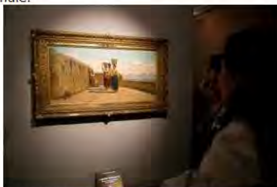
LA VISITA PRIVATA ALLA MOSTRA DI BOLDINI, VITTORIANO