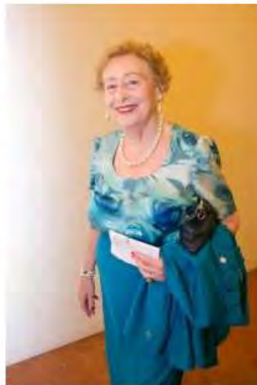
PRINCIPESSA ELETTRA MARCONI