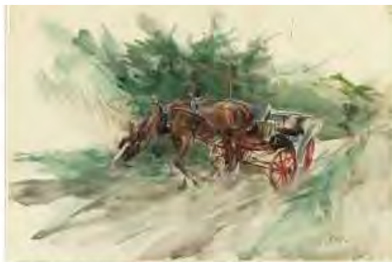
BOLDINI - CAVALLO CON CALESSE CAVALLO CON CALESSE

L'emozione grazie a Boldini diventa la prima forma della conoscenza, in un'epoca che viveva l'arte pittorica come la forma privilegiata per la diffusione delle immagini, in tempi ancora privi della forza della televisione e dei mass media popolari. È la storia di un attentato, quello compiuto ai danni di un essere umano, raccontato con la raffinatezza di chi guarda il mondo grazie a una tecnica sofisticata e preziosa. La ripetitività della violenza, quella sì, non ha abbandonato i nostri tempi. Ma non ci sono più narratori dalla mano felice come quella di Boldini, capace di far sognare mondi migliori anche quando il tema ritratto è dettato da un evento tragico.