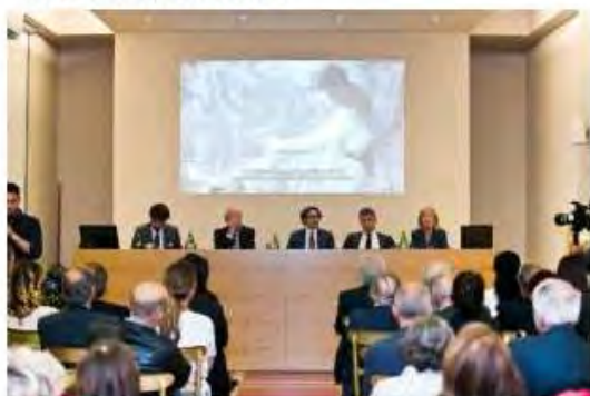
IL PANEL DEI RELATORI